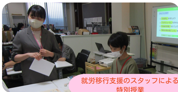
就労移行支援のスタッフによる 特別授業

当事業所には就労継続支援A型・B型事業所が併設されており、早い段階から具体的な就労イメージを持ちながら学ぶことができます。同建物内には西濃地区でも数少ない就労移行支援事業所も設置。さらに、西濃地区で唯一の就労選択支援事業を2025年12月より開始し、幅広い就労支援に対応しています。