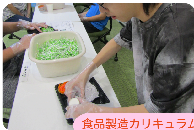
食品製造カリキュラム

全20種類の多彩なお仕事プログラムを用意しています。食品製造、仕分け作業、カタログ整理、接客対応など、将来の就労を見据えた実践的な作業を体験していただけます。