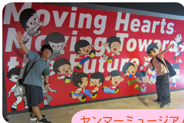
ヤンマーミュージアム

長期休みや土曜授業では、公共交通機関を使った外出カリキュラムを行っています。お小遣いの管理や公共交通機関の利用方法、時間の意識など、日常生活に必要なスキルを実践的に育てます。